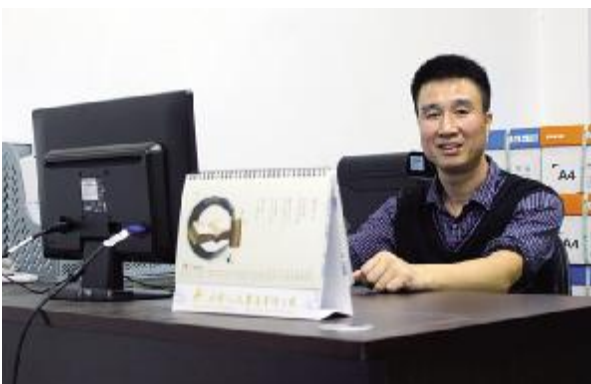
格言：长风破浪会有时，直挂云帆济沧海。

11月4日晚，本报记者应约前去国际学院进行采访。天还下着蒙蒙细雨，弥漫着令人清醒的冰凉空气。