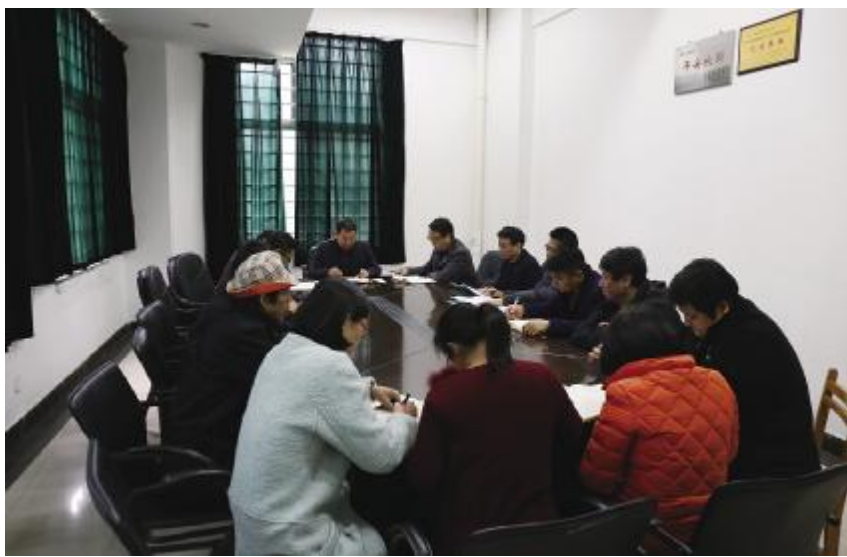
格言：师生需要在哪里，服务跟进在哪里。

面对学校繁重的安全保障、服务重任，校保卫处始终坚持“安全第一、预防为主、综合治理”的工作方针。